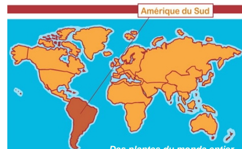
Des plantes du monde entier