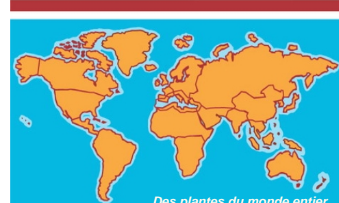
Des plantes du monde entier