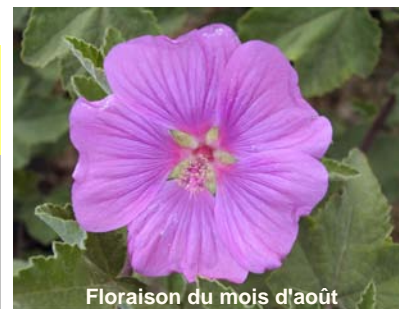
Floraison du mois d'août

L'une des meilleures variétés de lavatères, vigoureuse et rustique, d'une hauteur et d'un diamètre d'environ 2 m, mais d'une allure assez compacte. Grandes fleurs rose violacé, pendant tout l'été. Cultivar résistant aux maladies mais à planter en exposition ensoleillée et chaude, et en sol bien drainé.