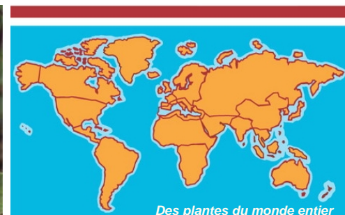
Des plantes du monde entier