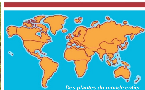
Des plantes du monde entier